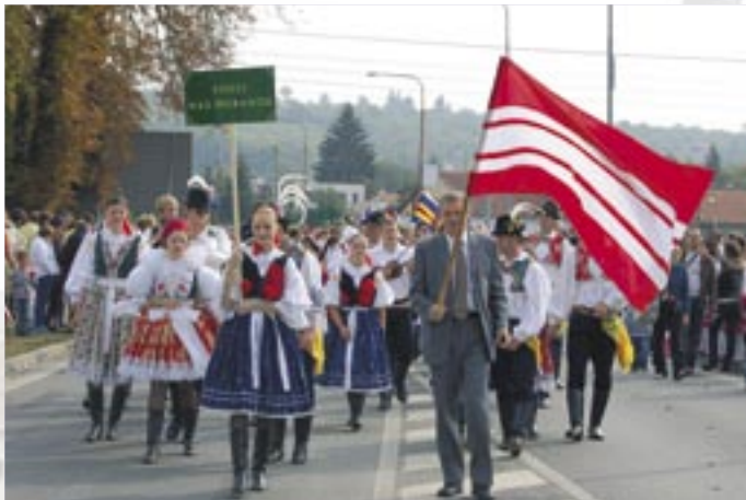
Veselí nad Moravou