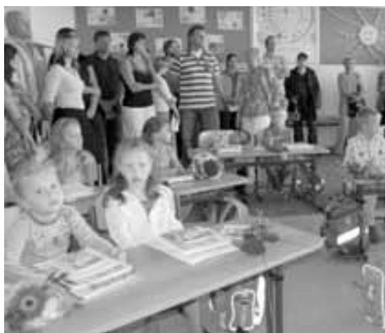
První třída v Ostrožské Nové Vsi.

Náš časopis dává školám možnost, aby informovaly o svých projektech