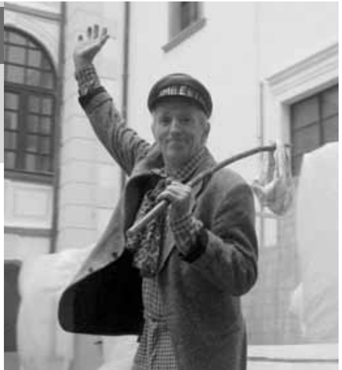
Jakoby tento snímek z divadelní hry „Galuškova Slovácka“ symbolicky ukazoval loučení starších s kulturou. Kdo mladší přijde po nich, není jasné.

Založení občanského sdružení Galuško Slovácko začala připravovat bezprostředně po odchodu do důchodu, to má dnes