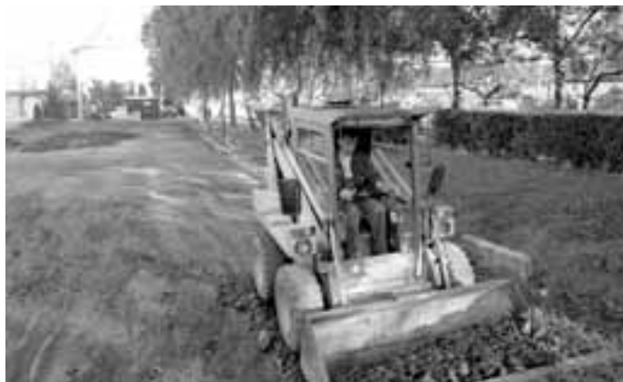
Dětské hřiště, které bylo v těchto místech, definitivně končí. Radnice slibuje nové a lepší hřiště na jiném místě.

Nejdříve zazvonil telefon. Muž z Ostrožské Nové Vsi se představil a chtěl po našem časopisu, abychom zjistili, cože se to děje v jednom z parků v Ostrožské Nové Vsi. „Jezdí tady bagr a likviduje hřiště, na kterém sportovaly děti, navíc se má cosi dělat i s parkem, kde hřiště je,“ stěžoval si. Slíbil jsem mu, že se budu snažit získat do tohoto čísla časopisu co nejvíce informací. Na novoveské radnici jsem položil několik desítek otázek, tak snad tedy v následujících řádcích svůj slib volajícím splním. A pokud máte také jakýkoliv dotaz, týkající se vaší obce nebo města, s klidem (nebo i neklidem) zavolejte.