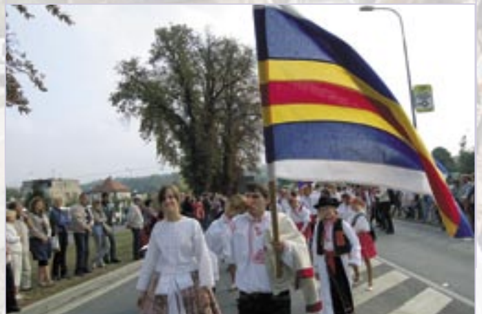
Ostrožská Nová Ves