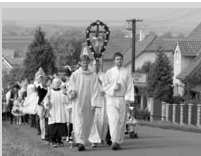
Letošní procesí právě vychází z Blatnice na Svatý Antonínek. Krojovaných v průvodu je v posledních letech stále více.