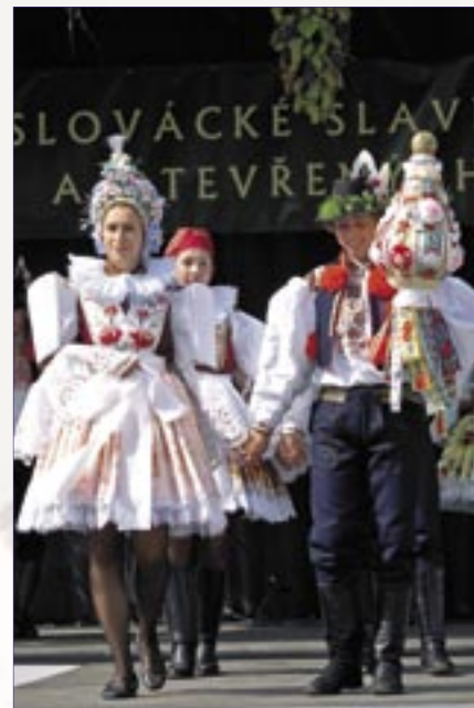
Ostrožská Nová Ves