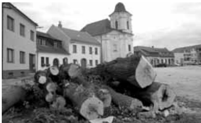
STROMY PADLY, REKONSTRUKCE ZAČALA. Historické Bartolomějské náměstí je bez stromů. Začala totiž rekonstrukce náměstí. Mnozí Veselané jistě s napětím čekají, jak bude náměstí vypadat po opravě.

spěchali, rekonstrukce totiž měla začít už v květnu, ale jedna ze stavebních firem, která soutěžila o zakázku, podala stížnost proti výběru jiné firmy. Se stížností ale neuspěla.