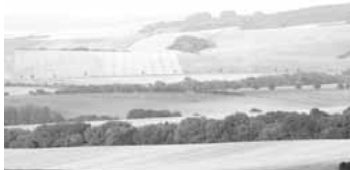
Jeden z krásných pohledů ze Střečkova kopce, který je jen kousek od Svatého Antonínka.

Mohli bychom vyjít přímo na Svatý Antonínek, odkud je opravdu krásný rozhled. Trochu nám tu však budou překážek okolní lesíky a remízky, a tak raději ještě trochu popojdeme na sousední Střečkův kopec. Na jeho vrcholu najdeme malý geologický odkryv