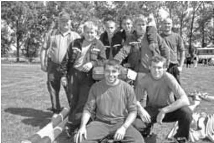
Družstvo hasičů z Blatnice pod Svatým Antonínkem.

měli byste být pohodáři, protože dobré výsledky se střídají s těmi horšími. Závodů je několik a nejlepší jsou nakonec ti, kteří si udržují výkonnost delší dobu.