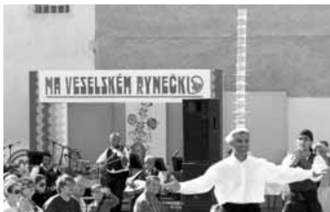
NEUVĚŘITELNÝ VÝKON. Při návštěvě veselských kulturních akcí se můžete dočkat i překvapení. Když jsem šel na pořad s názvem Na veselském rynečku, viděl jsem i vystoupení výborného folklorního souboru z Kypru. Jeden z jeho členů „tancoval“ s takovým množstvím skleniček na hlavě. Ani jedna nespadla.

na nějaký film, což vám velmi doporučuji, možná tuto změnu pocítíte díky uším. Promítací sál má totiž zcela nové ozvučení. Veselské kino tak sice promítá