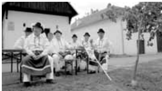
Odpočinek domácího mužského sboru.

Jedna z posledních „tetiček“, které můžete v Blatnici pod Sv. Antonínkem potkat v tradičním oblečení. V Blatnici i jinde na Slovácku je už za pár let nikde nepotkáme. Kdoví, jaký bude svět bez nich.