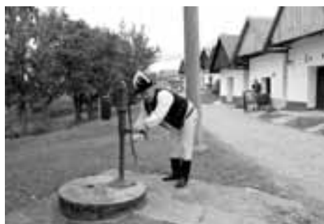
Bohužel - ze studny voda netekla.