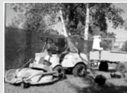
Nová technika pro údržbu zeleně

6. Blatnička – oprava místní komunikace. Opravená komunikace v Blatničce spojuje centrální část obce s obytnou a smíšenou zástavbou. Dle potřeby se doplnily obrubníky a výškově upravily kanalizační šachty. Nový kryt je z asfaltového betonu o tloušťce 50 mm. Celková rekonstruovaná plocha činí 443 m 2 , délka 115m.