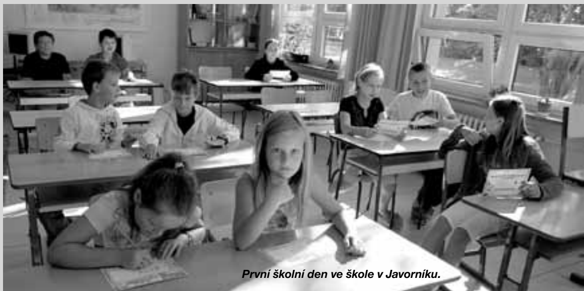
První školní den ve škole v Javorníku.