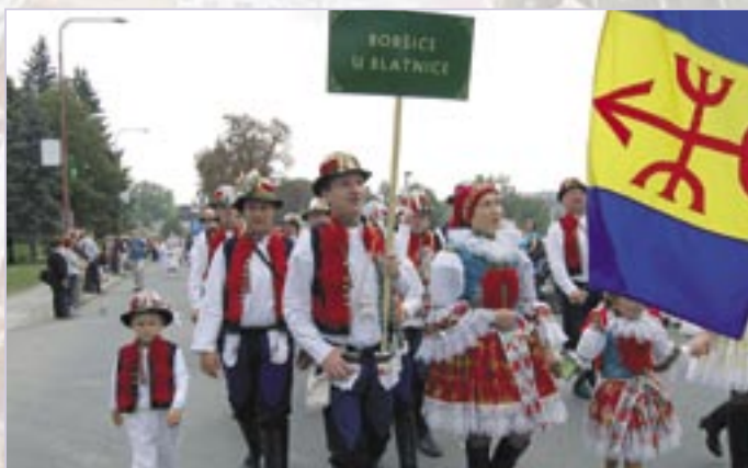
Boršice u Blatnice