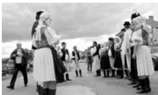
Temperamentní soubor Kopa z Myjavy.