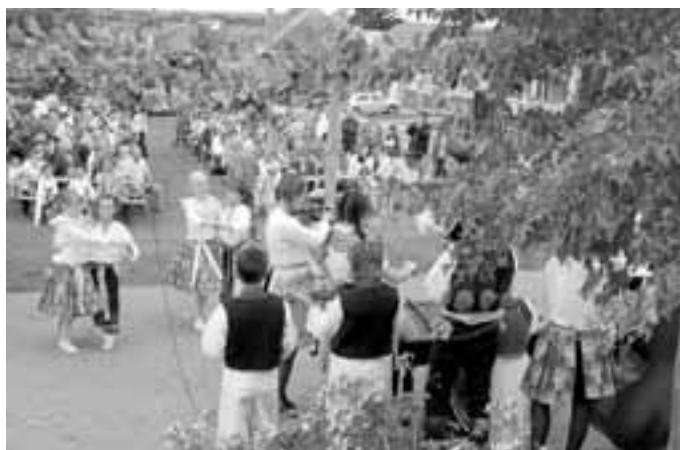
Na horním snímku jde průvod krojovaných v čele se starostou k vinným sklepům, na dolním vidíte, jak to u sklepů vypadalo.

Když jsem poslouchal místní mladou cimbálovou muziku a také děti z Vavříнку, obdivoval jsem, jak moc v Blatnici udělali v poslední době pro rozvíjení lidové muziky i tradic.