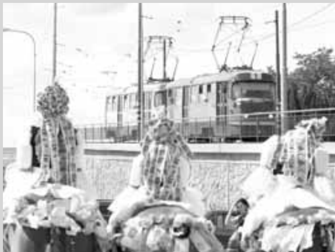
Jízda králů v Brně aneb slovácká tradice v moravské metropoli. Zájem Brňanů byl slabý.

Hlucká jízda králů zažila Brno jako město bez vztahu k tradicím