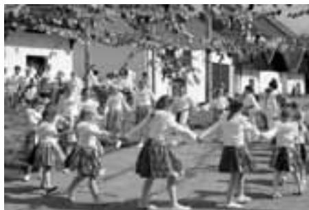
Blatnická naděje v podobě dětí.