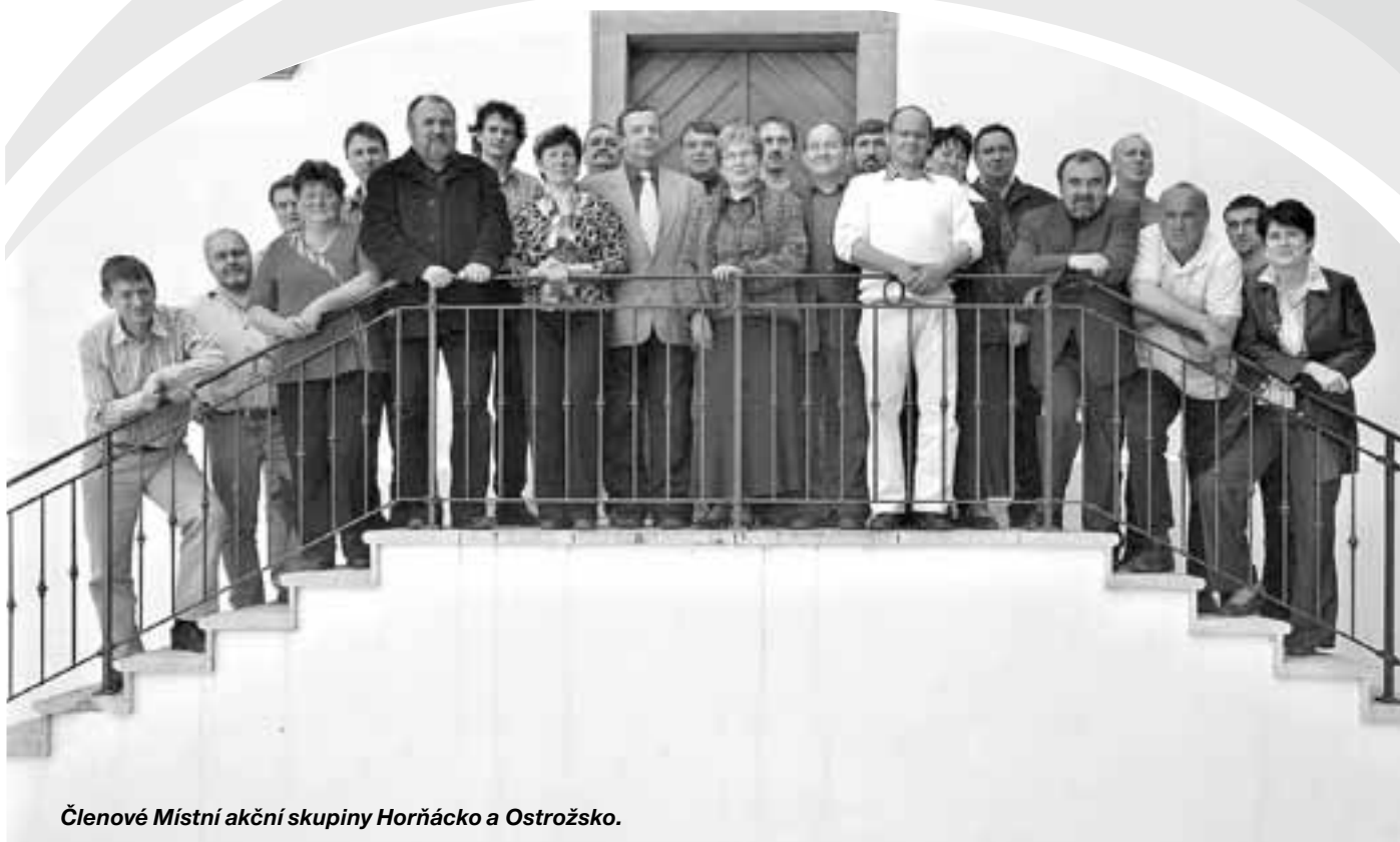
Členové Místní akční skupiny Hornácko a Ostrožsko.