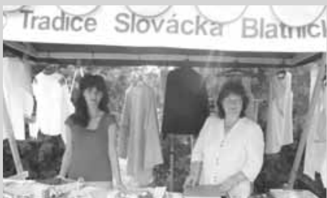
Pracovnice Tradic Slovácka se snaží dělat hodně pro svou propagaci. Takto jsem je nafotil v létě na veselském jarmarku.