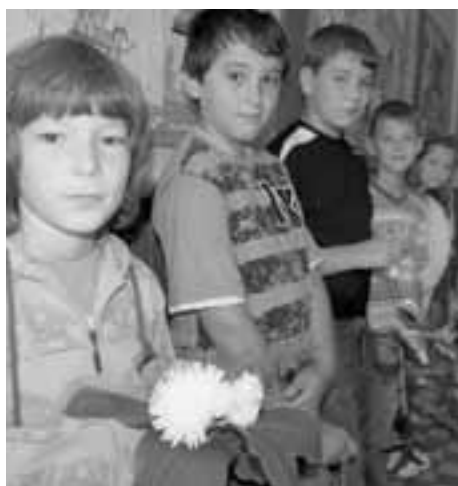
Některé děti ze školy v Louce.

I na začátku nového školního roku bychom rádi sdělili všem učitelům, žákům i vám čtenářům, že se chceme v našem časopise co nejvíce věnovat dění ve školách, zajímavým projektům i nápadům. Aktivitu škol považujeme za mimořádně důležitou.