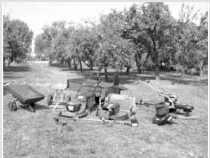
Nová technika pro údržbu zeleně