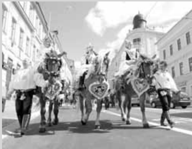
I přes nezájem Brňanů byl pohled na hluckou jízdu králů v ulicích města nádherný.

„Hýlom, hýlom...“ ozývalo se z úst vyvolávačů hlucké jízdy králů v brněnských ulicích, ale s ozvěnou jich slov jako by končila i naděje, že slovácké tradice mužův v moravské metropoli někoho zaujmout.