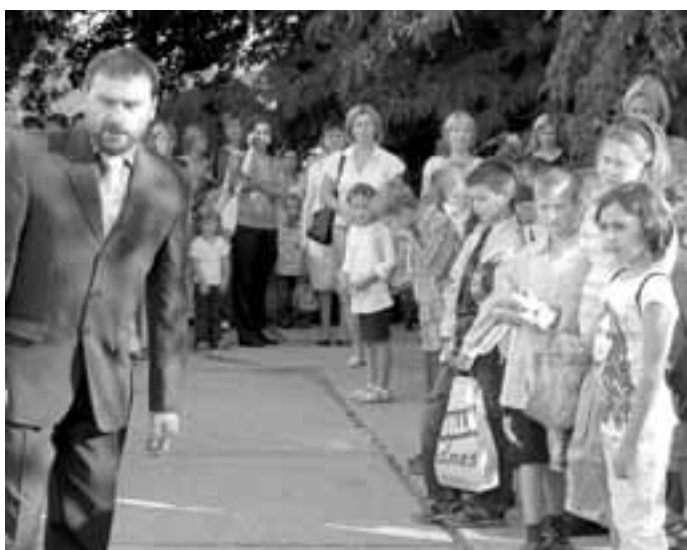
Ředitel Základní školy v Ostrožské Lhotě při zahájení.