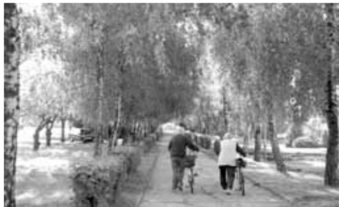
A zmizí také tato březová alej a japonské sakury, které jsou vlevo na této fotce. Radnice slibuje nové a zdravé stromy.

Anabáze jeho vzniku a zániku by vydala na několik stránek, v posledních týdnech se totiž objevili zastánci zrušení hřiště i jeho podporovatelé, stejně tak zastupitelstvo jednou odhlasova-