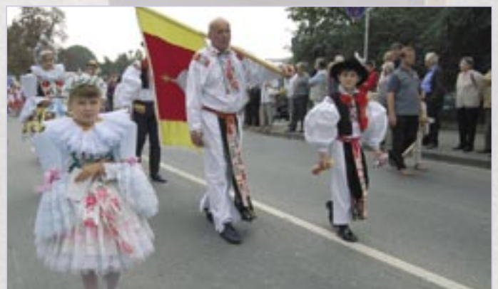
Blatnice pod Svatým Antonínem