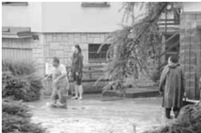
Snímek z letošní povodně.

Podle ní půjde o projekty, jejichž realizace si vyžádá desítky milionů korun. „Spolknou“ je odvodňovací příkopy, propustky, mostky, sběrače vody, ale také zalučnění některých pozemků a výsadba biokoridoru. „Výsadba je důležitá, protože na nevyjše položených místech se letos objevila bohužel kukuřice, takže povodeň automaticky splachovala i ornici,“ sděluje starostka.