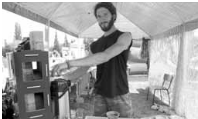
A NAKONEC ČAJ. A na závěr pozvání na čaj... Tento muž na snímku čaji ve Veselí rozumí jako málokdo jiný.